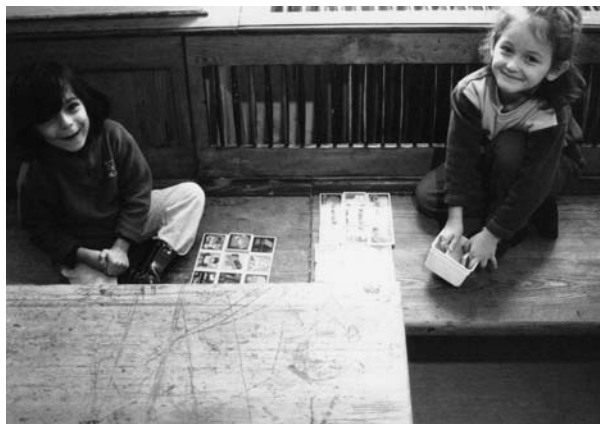
„Zwergengruppe“ in der Proviantbachstraße

Sie unterscheiden sich durch ihre Muttersprache und Vorgeschichte von Kindern, die hier schon länger leben.