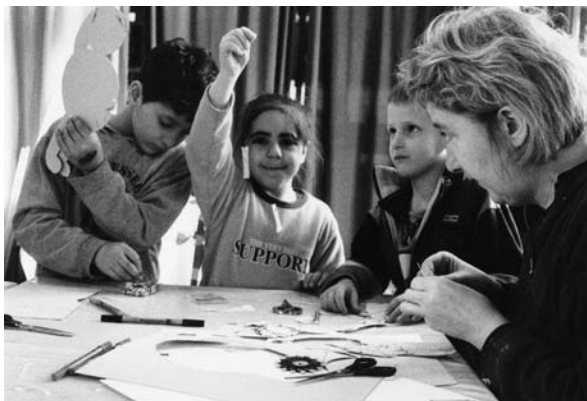
Kunstwerkstatt bei der Kunstschule Palette

Dieser Prospekt wurde unterstützt von Claudia Baumann (Gestaltung) und Teresa Gruber (Fotografie).