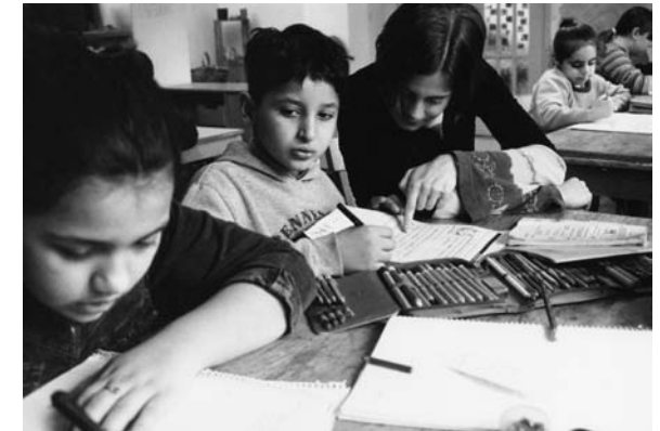
Hausaufgabenhilfe im Proviantbachquartier