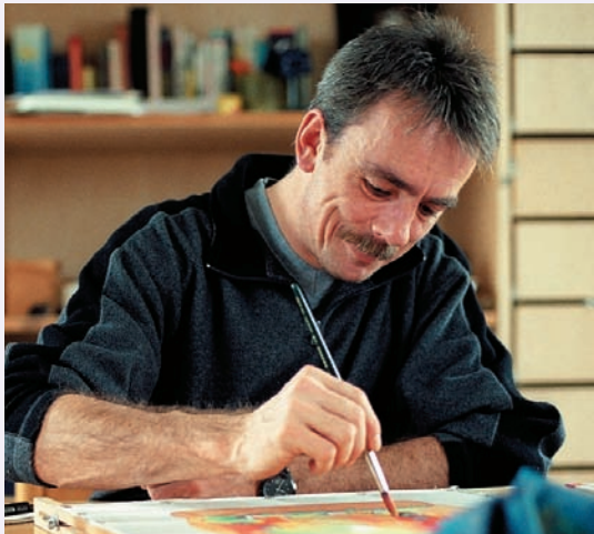
Die Freizeit sinnvoll zu nutzen, das vermittelt das Beschäftigungstraining

Ziel unserer Hilfe ist eine Verbesserung ihrer Situation. Durch die Überwindung bzw. Verringerung sozialer Probleme und die Förderung der Entwicklung sozialer Kompetenzen soll ein straffreies Leben ermöglicht werden.