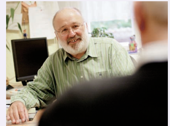
In einem persönlichen Aufnahmegespräch wird alles Wichtige besprochen

Das sozialtherapeutische Angebot umfasst Einzel- und Gruppengespräche, Arbeits-, Beschäftigungs- und Hauswirtschaftstraining, Freizeitmaßnahmen und Erlebnispädagogik. Zentraler Bestandteil der sozialtherapeutischen Maßnahmen ist das Zusammenleben in der Gruppe als soziales Lernfeld.