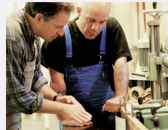
Eine hauseigene Schreinerei bietet Gelegenheit zur beruflichen Wiedereingliederung

Voraussetzung für die Aufnahme im WEZ ist ein persönliches Aufnahmegespräch. Noch Inhaftierte sollen möglichst im Rahmen eines Hafturlaubs ein mehrere Tage dauerndes Probewohnen bei uns verbringen. Die Kosten müssen vor der Aufnahme durch den Sozialdienst der JVA oder durch eine Beratungsstelle geklärt werden.